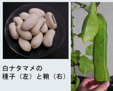
白ナタマメの 種子 (左) と鞘 (右)

植物性食品の多くは加工食品への利用がほとんどありません。その一因として、加工方法や加工特性を明らかにする研究報告が乏しいことが挙げられます。私はこれまでに、利用の少ない雑豆のナタマメに着目し、食品としての利用促進を目指した基礎的研究に取り組んできました。本講演では、ナタマメの加工方法、加工特性のほか、新たに見出した機能性成分についての知見と今後の可能性について紹介します。